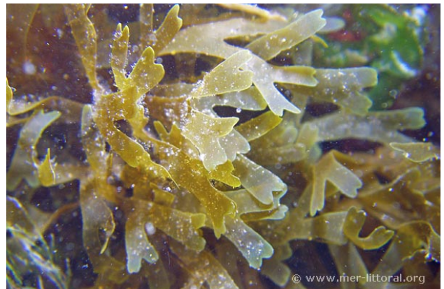
Baie de Concarneau, France, 5 mètres, 2006, WBN