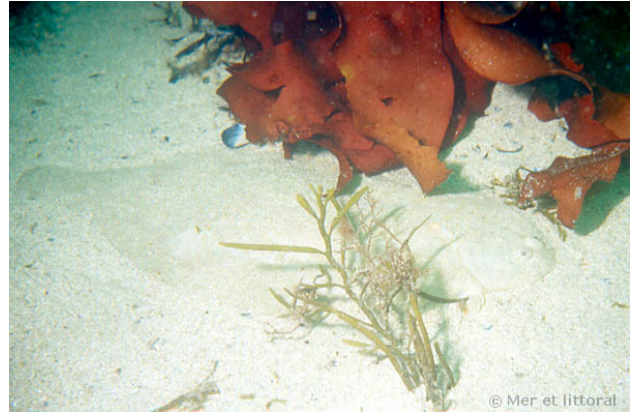
Iles Glénan, France, 11 mètres, 2004, WBN

Textes de Anne Bay-Nouailhat © 2004 - 2025