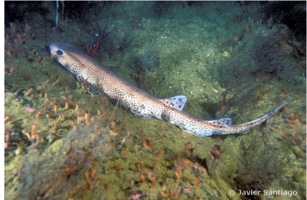
Ria de Arosa, Espagne, 32 mètres, 2006, JS

Textes de Anne Bay-Nouailhat © 2006 - 2024