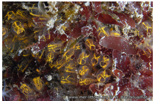
Illes Medes, Espagne, 5 mètres, 2009, WBN