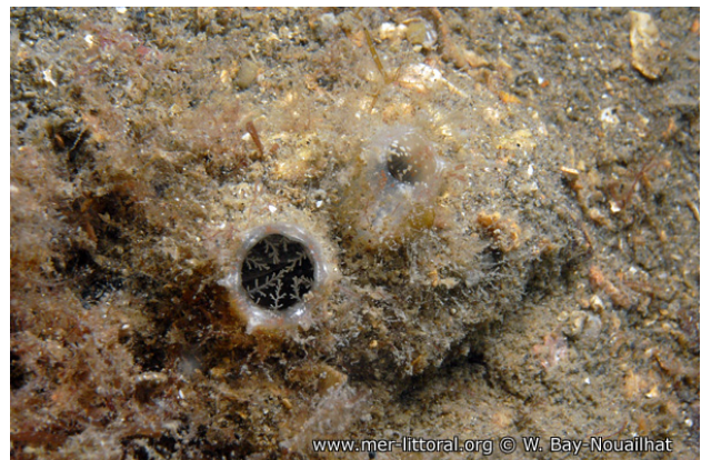
Rade de Brest, France, 8 mètres, 2011, WBN