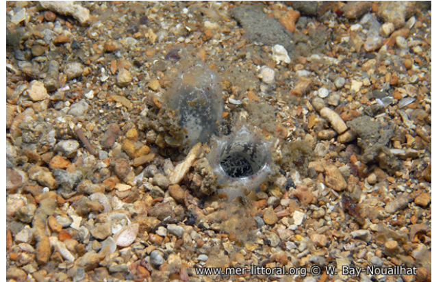
Rade de Brest, France, 9 mètres, 2011, WBN

Textes de Anne Bay-Nouailhat © 2011 - 2025