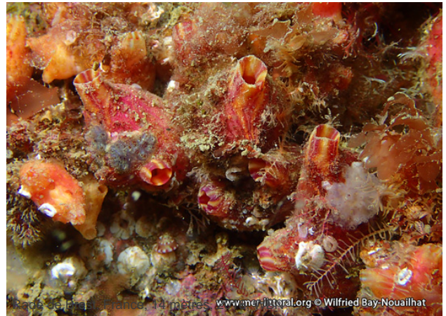
Rade de Brest, France, 14 mètres