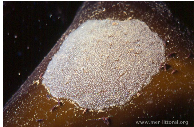
Baie de Concarneau, France, 2 mètres, 2011, WBN

Textes de Anne Bay-Nouailhat © 2007 - 2024