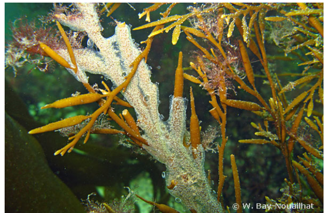
Baie de Concarneau, France, 3 mètres, 2011, WBN