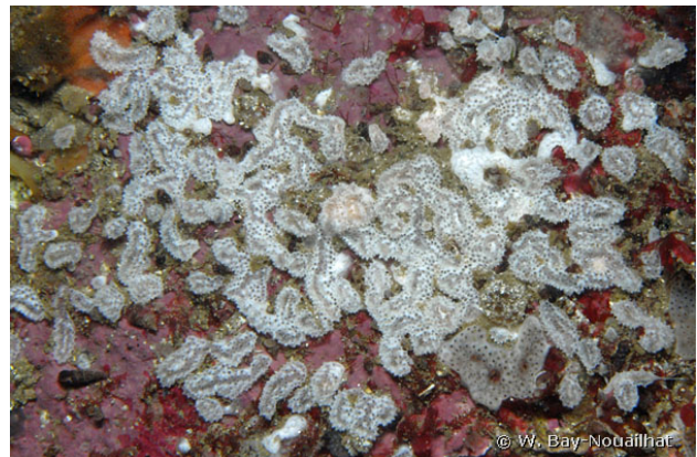
Pointe de Trévignon, France, 9 mètres, 2011, WBN