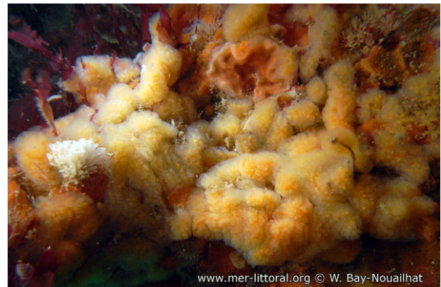
Camaret, France, 20 mètres, 2011, WBN