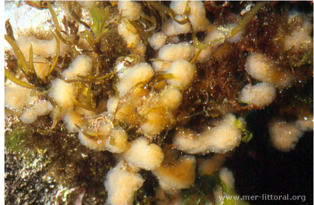
Iles Glénan, France, 4 mètres, 2011, WBN

Textes de Anne Bay-Nouailhat © 2007 - 2025