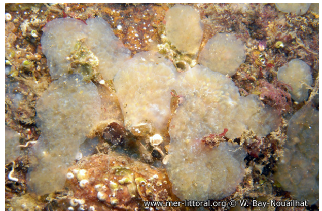
Rade de Brest, France, 3 mètres, 2011, WBN