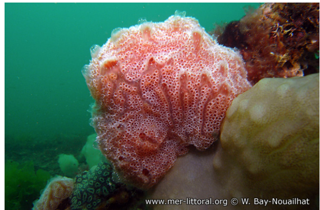
Rade de Brest, France, 8 mètres, 2011, WBN