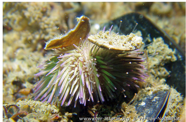
Ria d'Étel, France, 7 mètres, 2011, WBN