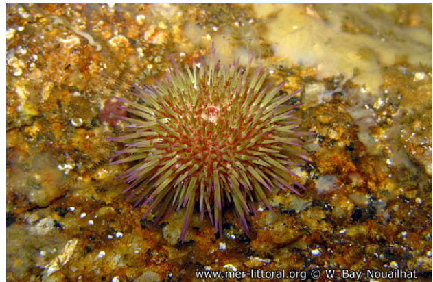
Baie de Concarneau, France, 4 mètres, 2011, WBN