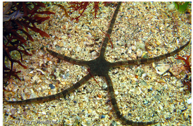
Baie de Concarneau, France, 3 mètres, 2008, WBN