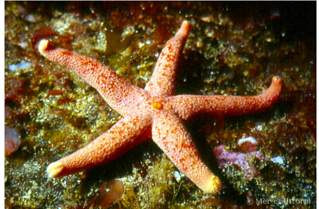
Iles Glénan, France, 20 mètres, 2005, WBN

Textes de Anne Bay-Nouailhat © 2005 - 2024