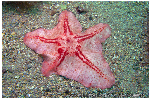
Rade de Brest, France, 14 mètres, 2011, WBN