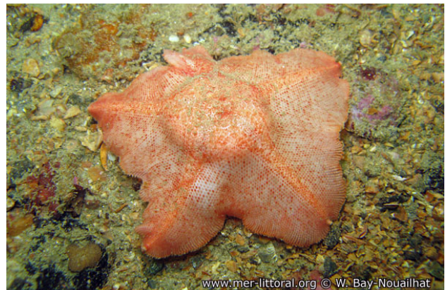
Rade de Brest, France, 16 mètres, 2008, WBN