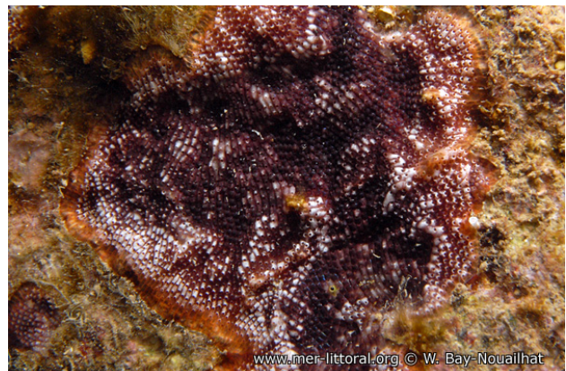
Iles Medes, Espagne, 10 mètres, 2011, WBN