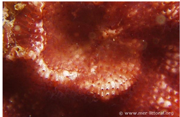
Iles Glenan, France, 11 mètres, 2006, WBN