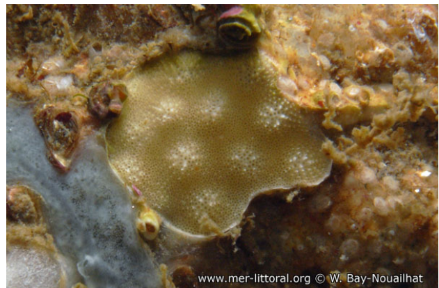
Illes Medes, Espagne, 25 mètres, 2008, WBN