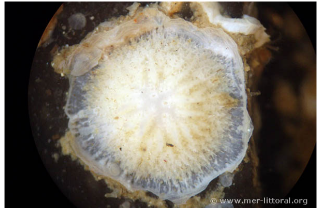
Baie de Concarneau, France, 4 mètres, 2009, WBN

Textes de Anne Bay-Nouailhat © 2009 - 2024