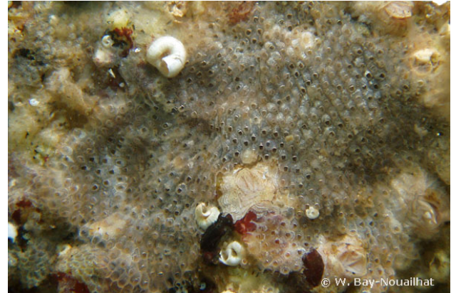
Baie de Concarneau, France, 3 mètres, 2007, WBN

Textes de Anne Bay-Nouailhat © 2009 - 2025