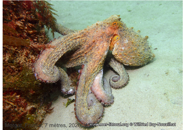
Morgat, France, 7 mètres, 2020

Textes de Anne Bay-Nouailhat © 2005 - 2024