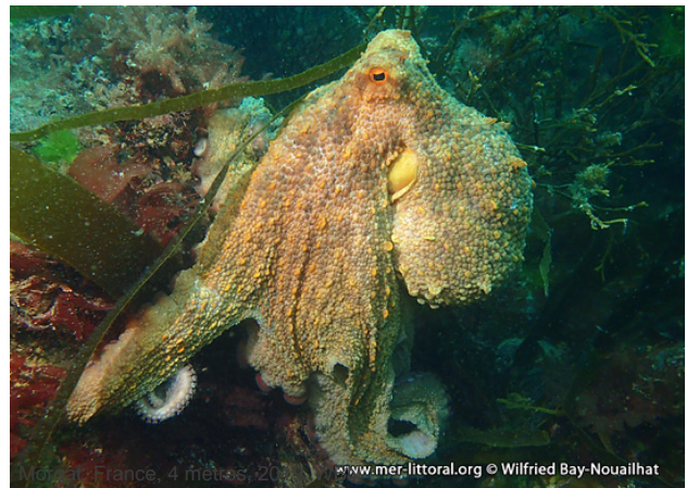
Morgat, France, 4 mètres, 2020