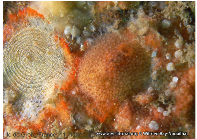
Ile de Groix, France, 11 mètres, 2010