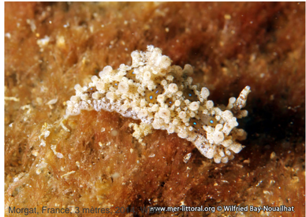
Morgat, France, 3 mètres, 2013, www.mer-littoral.org © Wilfried Bay-Nouailhat

Textes de Anne Bay-Nouailhat © 2009 - 2025