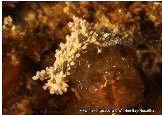
Morgat, France, 4 mètres, 2014