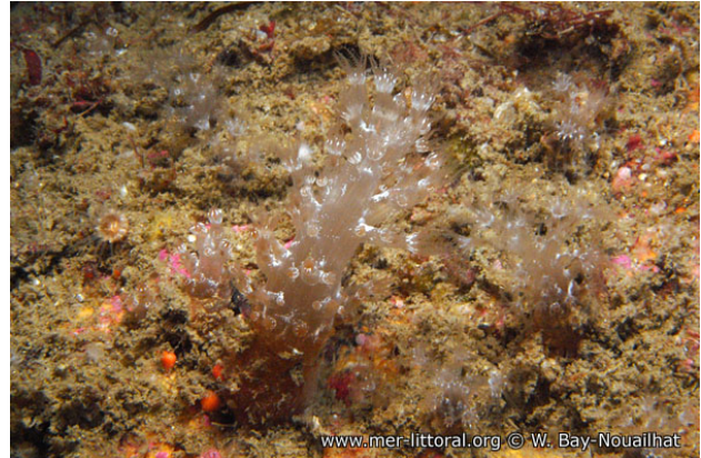
Iles Glénan, France, 28 mètres, 2009, WBN

Textes de Wilfried Bay-Nouailhat © 2010 - 2025