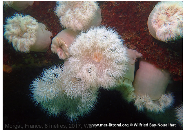
Morgat, France, 6 mètres, 2017, WBN www.mer-littoral.org © Wilfried Bay-Nouailhat

Textes de Wilfried Bay-Nouailhat © 2008 - 2024