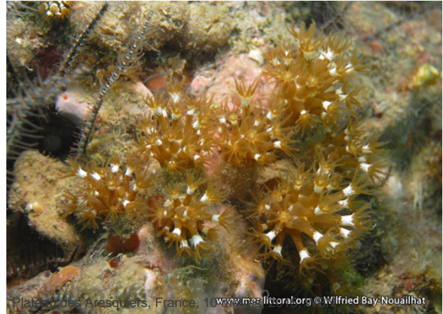
Plateau des Arasquiers, France, 10 mètres, 2009, WBN

Textes de Wilfried Bay-Nouailhat © 2009 - 2024