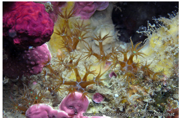
Illes Medes, Espagne, 14 mètres, 2009, WBN