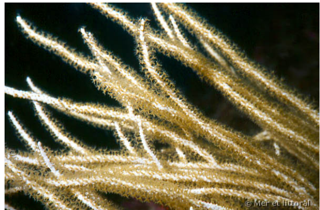
Illes Medes, Espagne, 12 mètres, 2004, WBN