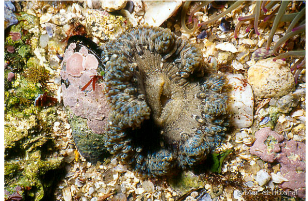
Iles Glénan, France, 1 mètre, 2004, WBN

Textes de Wilfried Bay-Nouailhat © 2004 - 2024