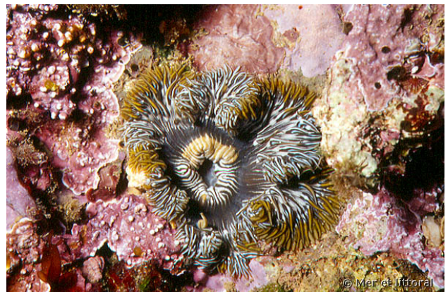
Iles Medes, Espagne, 6 mètres, 2004, WBN