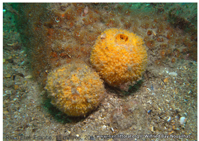
Ria d'Etel, France, 11 mètres, 2011