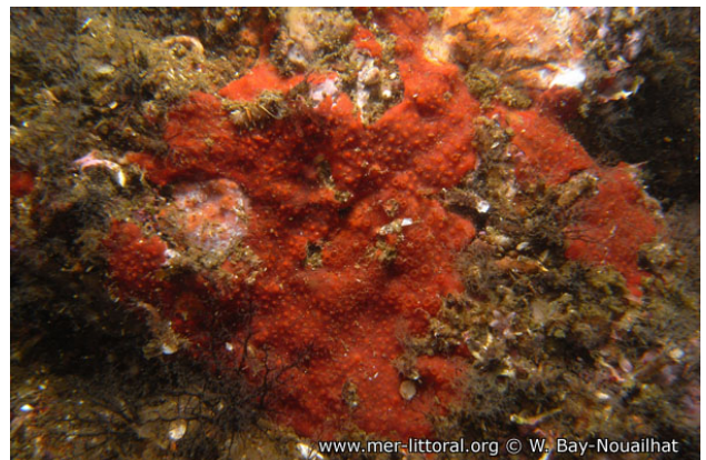
Ria de Arosa, Espagne, 12 mètres, 2009, WBN