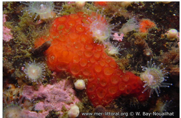
Ria de Arosa, Espagne, 20 mètres, 2009, WBN