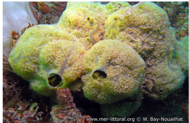
Rade de Brest, France, 3 mètres, 2011, WBN