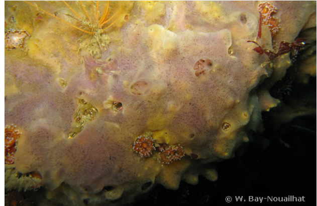
Rade de Brest, France, 14 mètres, 2008, WBN

Textes de Wilfried Bay-Nouailhat © 2004 - 2024