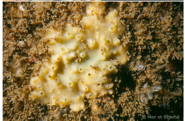
Port Manec'h, France, 3 mètres, 2004, WBN