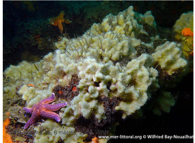
Port Manec'h, France, 6 mètres, 2004, WBN www.mer-littoral.org © Wilfried Bay-Nouailhat

Textes de Wilfried Bay-Nouailhat © 2004 - 2024