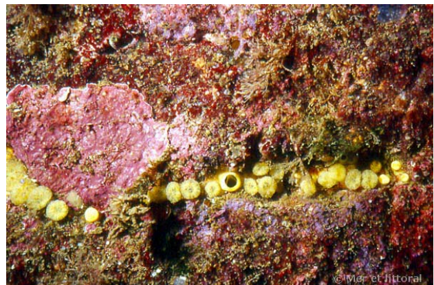
Iles Glénan, France, 14 mètres, 2004, WBN