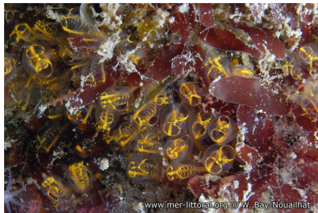
Illes Medes, Espagne, 5 mètres, 2009, WBN