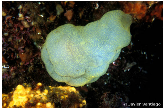
Ria de Muros, Espagne, 11 mètres, 2011, JS

Textes de Anne Bay-Nouailhat © 2007 - 2026