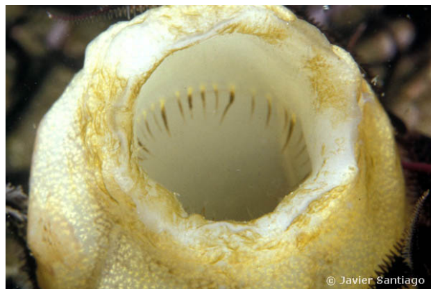
Ria de Muros, Espagne, 11 mètres, 2011, JS