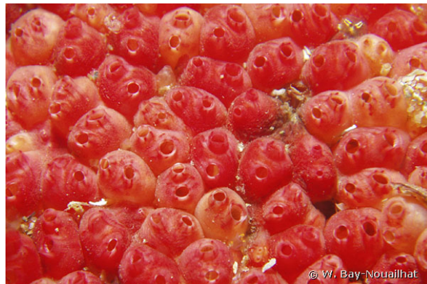
Camaret, France, 9 mètres, 2011, WBN

Textes de Anne Bay-Nouailhat © 2007 - 2026