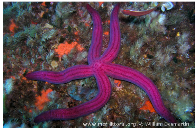
Corse, France, 15 mètres, 2007, WD