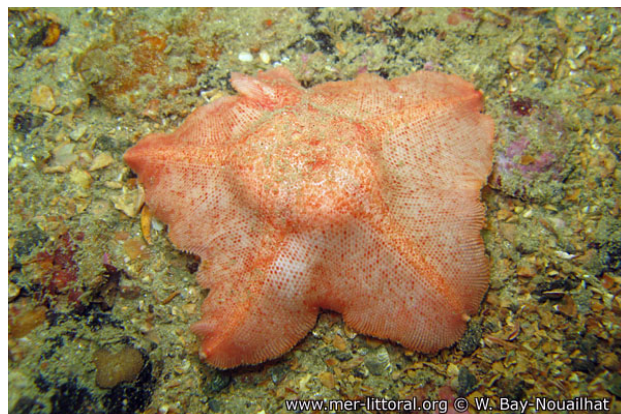
Rade de Brest, France, 16 mètres, 2008, WBN