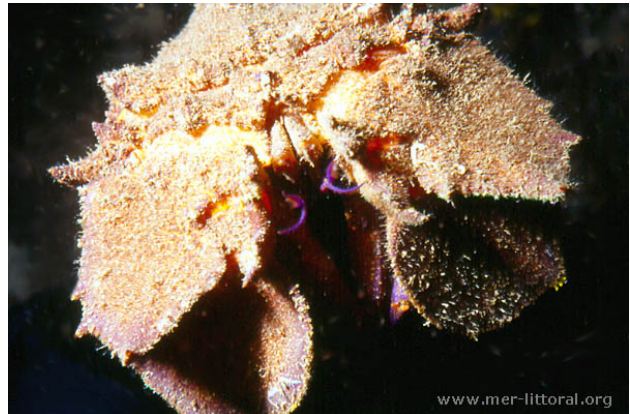
Illes Medes, Espagne, 17 mètres, 2011, WBN

Textes de Anne Bay-Nouailhat © 2007 - 2026