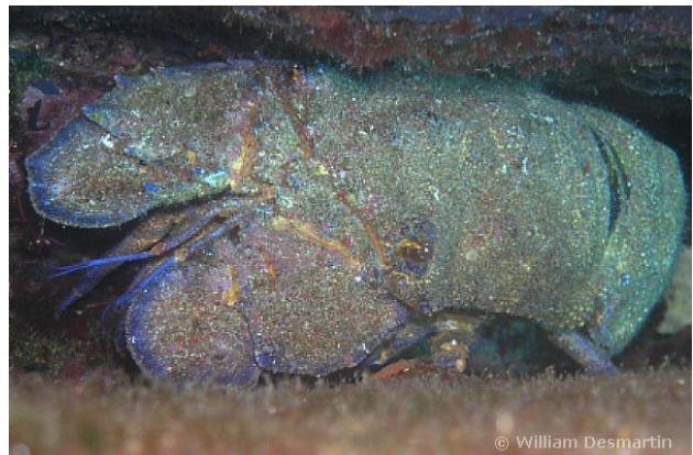
Capo Rosso, France, 20 mètres, 2011, WD