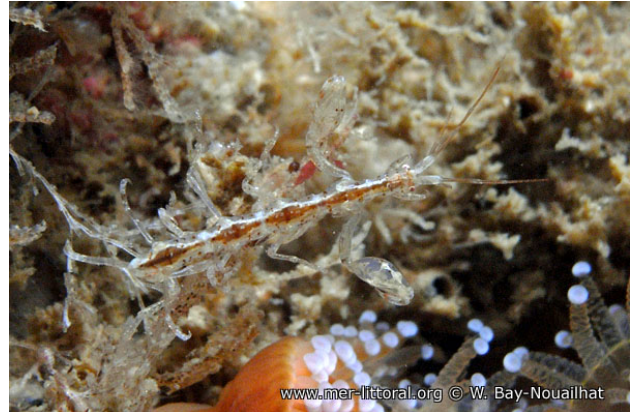
Iles Glénan, France, 12 mètres, 2009, WBN

Textes de Anne Bay-Nouailhat © 2009 - 2026