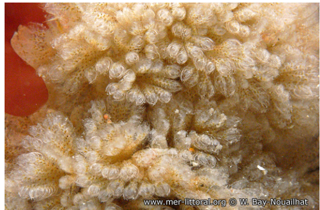
Vue rapprochée, WBN