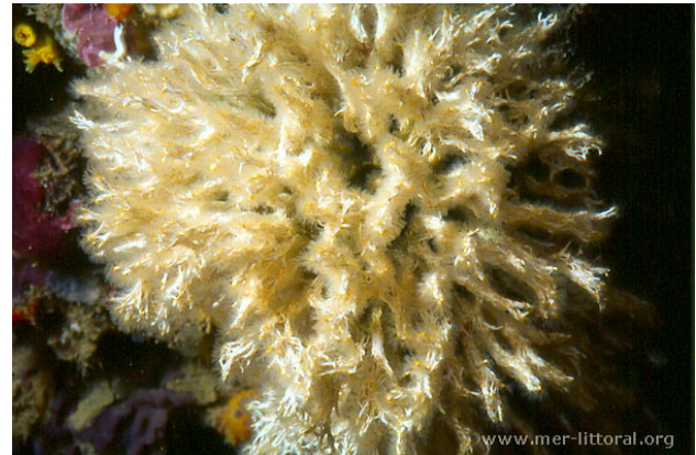
Illes Medes, Espagne, 16 mètres, 2005, WBN

Textes de Anne Bay-Nouailhat © 2006 - 2026