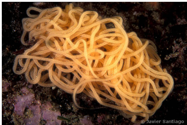
Ponte. Isla Ons, Espagne, 9 mètres, 2011, JS