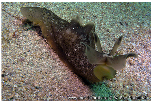
Ile de Groix, France, 5 mètres, 2011, WBN