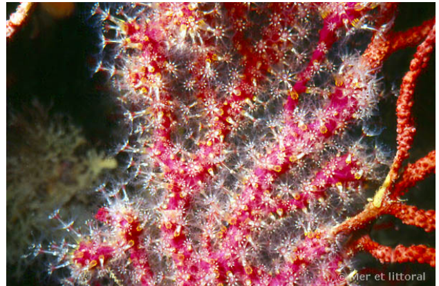
Illes Medes, Espagne, 17 mètres, 2004, WBN

Textes de Wilfried Bay-Nouailhat © 2005 - 2026