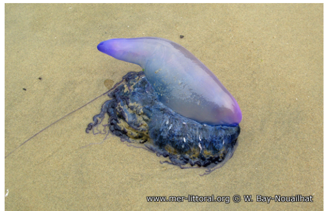
Biarritz, France, échouée, 2011, WBN