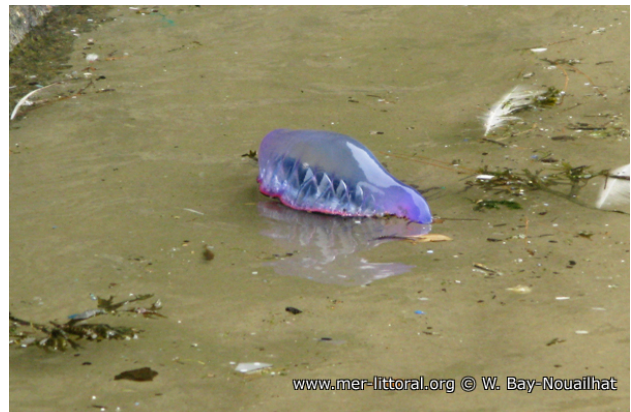
Biarritz, France, en surface, 2011, WBN