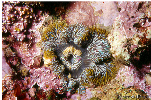
Illes Medes, Espagne, 6 mètres, 2004, WBN