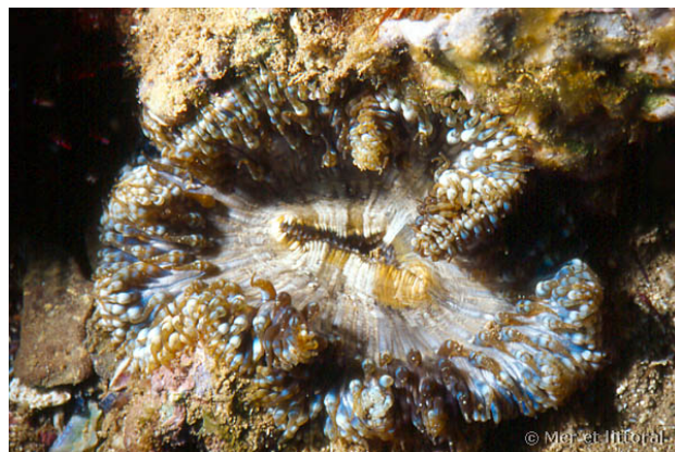
Illes Medes, Espagne, 5 mètres, 2004, WBN