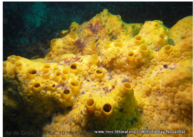
Ile de Groix, France, 10 mètres, 2006, www.mer-littoral.org © Wilfried Bay-Nouailhat