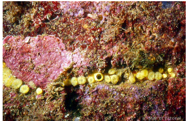
Iles Glénan, France, 14 mètres, 2004, WBN